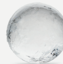
528 Premium Ice Ball